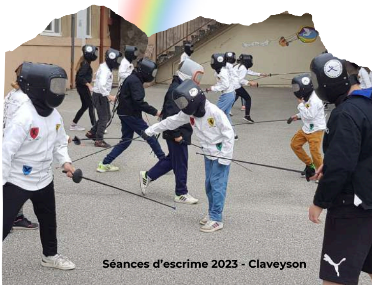
Séances d'escrime 2023 - Claveyson