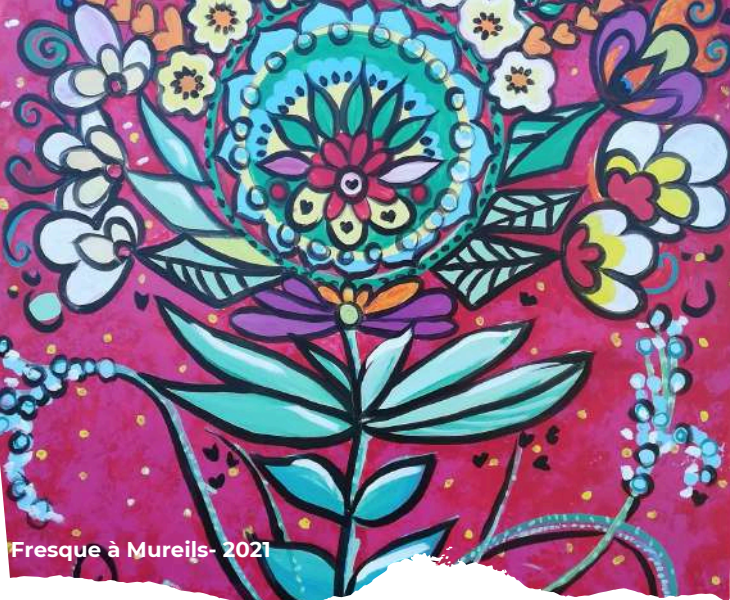
Fresque à Mureils - 2021