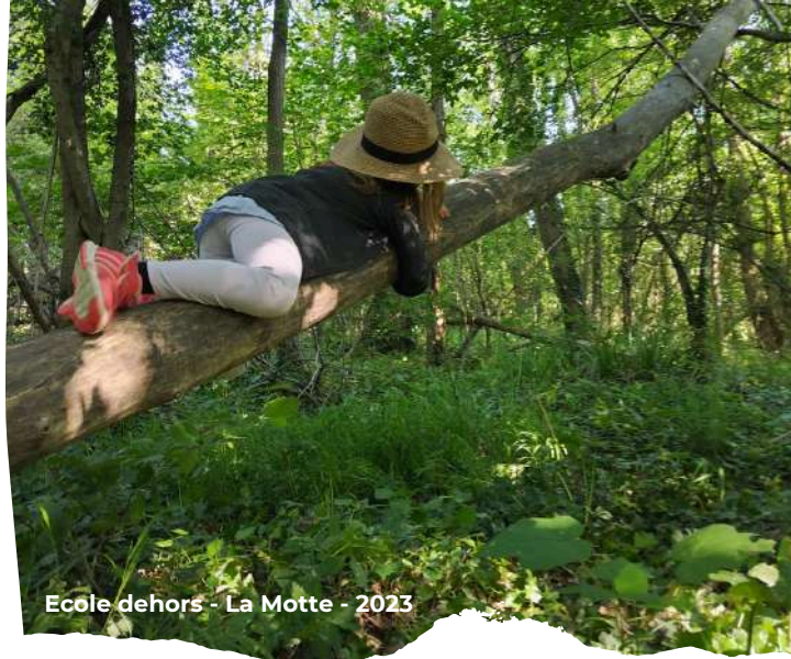
École dehors - La Motte - 2023

École de Mureils St-Jean-de-Galaure 04 75 68 45 40