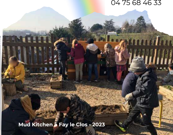
Mud Kitchen à Fay le Clos - 2023